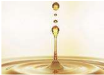
Macérat huileux au Tabouret du Cervin BIO. Organic oily extract from the Tabouret du Cervin.

The discovery of this alpine plant, which grows in Switzerland exclusively at the outskirts of Mount Cervin, arises from a close collaboration between cosmetics professionals, botanists and specialists of Swiss flora. Swiss Mineral Cosmetics has a crop, 2200 metres in altitude in private land close to the legendary mountain.