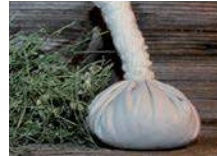
Pochon aux plantes alpines médicinales BIO. Pouch of organic medicinal alpine plants.